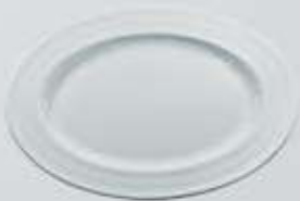
PLATÓN OVALADO OVAL PLATE RPO34 (34 cm.)