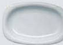
PLATÓN RECTANGULAR RECTANGULAR PLATE DEPR29 (29 cm.) DEPR34 (34 cm.) DEPR39 (39 cm.)