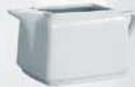
SALSERA RECTANGULAR CON ASA RECTANGULAR SAUCE BOWL WITH HANDLE ASRA (300 cc.)