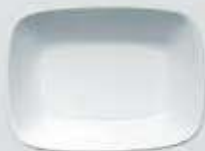
PLATÓN RECTANGULAR HONDO DEEP RECTANGULAR PLATE DEPRH14 (14 cm. - 150 cc.) DEPRH17 (17 cm. - 250 cc.) DEPRH20 (20 cm. - 450 cc.)