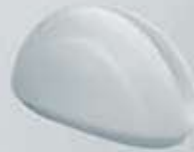
SERVILLETERO NAPKIN HOLDER DSV