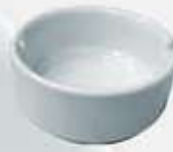
CENICERO ASHTRAY DCE (8.5 cm.)