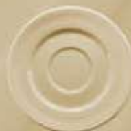
▶ PLATO PARA TAZA SAUCER RBPT90 (90 cc.) RBPT0230 (230 cc.)