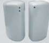
PIMENTERO-SALERO PEPPER SHAKER-SALT SHAKER TPIM TSAL