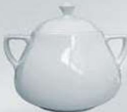
SOPERA CON TAPA SOUP TUREEN + LID DESTC (3.200 cc.)