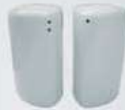
PIMENTERO-SALERO PEPPER SHAKER-SALT SHAKER TPIM TSAL