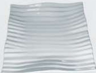
PLATÓN CUADRADO SQUARE PLATE APEOC35 (35x35 cm.) APEOC41 (41x41 cm.)