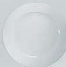
PLATO PAN-PASTEL- TRINCHE-BASE FLAT PLATE DPT16 (16 cm.) DPT20 (20 cm.) DPT24 (24 cm.) DPT26 (26 cm.) DPT27 (27 cm.) DPT32 (32 cm.)