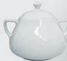
SOPERA CON TAPA SOUP TUREEN + LID DESTC (3.200 cc.)