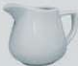
JARRITA CREMERA- LECHERA CREAMER DJC150 (150 cc.) DJL280 (280 cc.)