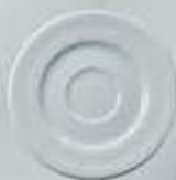
PLATO PARA TAZA SAUCER RPT90 (90 cc.) RPT0230 (230 cc.)