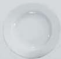
PLATO SOPERO DEEP PLATE DPS22 (22 cm.) DPS23 (23 cm.)