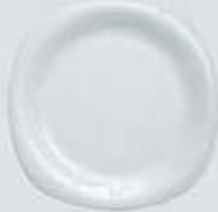
PLATO PASTEL-TRINCHE FLAT PLATE CPPT18 (18 cm.) CPPT20 (20 cm.) CPPT25 (25 cm.) CPPT27 (27 cm.) CPPT30 (30 cm.)