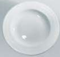
PLATO SOPERO DEEP PLATE RPS23 (23 cm.)