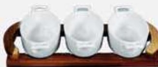
JGO. 3 CAZUELITAS MED. OVALES C/ASAS + BASE DE MADERA 3 OVAL BOWLS + WOOD TRAY AJ3CMOBM (31x14x5 cm.)