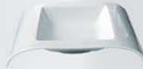
PLATO GRAPA PLATE APG2315 (23x15 cm. - 180 cc.) APG3022 (30x22 cm. - 500 cc.)