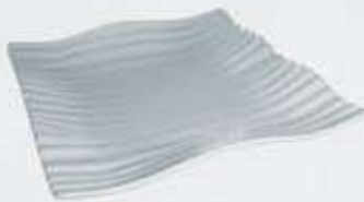
PLATITO PARA TAPAS- PLATO CUADRADO SQUARE PLATE APTOC8 (8x8 cm.) APPOC10 (10x10 cm.) APPOC15 (15x15 cm.) APPOC20 (20x20 cm.) APEOC25 (25x25 cm.) APEOC30 (30x30 cm.)