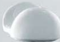
SERVILLETERO INVERTIDO NAPKIN HOLDER DSVI