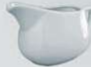
SALSERA CON ASA SAUCEBOAT DSA (400 cc.)