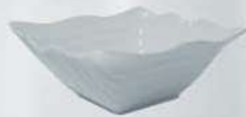
ENSALADERA CUADRADA SALAD BOWL AEOC21 (21x21x9 cm. - 1.000 cc.)