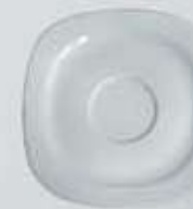
PLATO PARA TAZA CAFÉ CUADRADA SAUCER DEPC90 (90 cc.) DEPC170 (170/230 cc.)