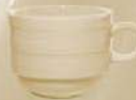
▶ TAZA CAFÉ CUP RBTC90 (90 cc.) RBTC230 (230 cc.)