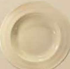
▶ PLATO PASTA DEEP PLATE RBPP30 (30 cm.)