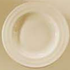
▶ PLATO SOPERO DEEP PLATE RBPS23 (23 cm.)