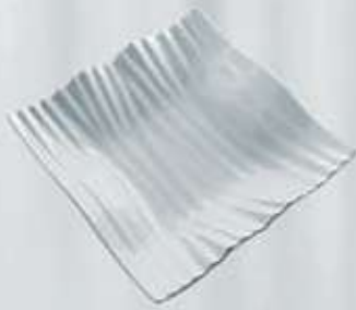
PLATO HONDO CUADRADO SQUARE DEEP PLATE APHOC20 (20.5x20.5 cm.)