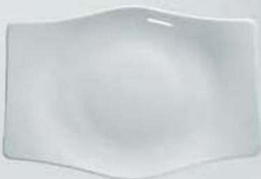
PLATÓN RECTANGULAR FLAT PLATE OPTR36 (36 cm.)