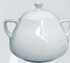
SOPERA CON TAPA SOUP TUREEN + LID DESTC (3.200 cc.)