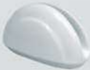
SERVILLETERO NAPKIN HOLDER DSV