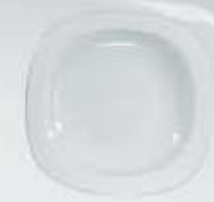
PLATO SOPERO DEEP PLATE DEPSC23 (23 cm.)