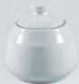
AZUCARERA REDONDA CON TAPA SUGAR BOWL + LID DAT