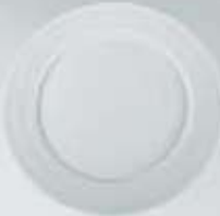
PLATO PAN-PASTEL- TRINCHE-BASE FLAT PLATE RPT16 (16 cm.) RPT20 (20 cm.) RPT24 (24 cm.) RPT27 (27 cm.) RPB32 (32 cm.)