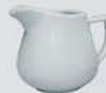
JARRITA CREMERA- LECHERA CREAMER DJC150 (150 cc.) DJL280 (280 cc.)