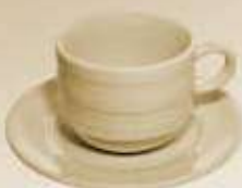
▶ JGO. TAZA Y PLATO CUP + SAUCER RBTP90 (90 cc.) RBTP230 (230 cc.)