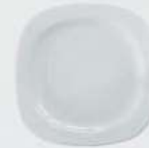
PLATO PAN-PASTEL- TRINCHE-BASE FLAT PLATE DEPTC16 (16 cm.) DEPTC18 (18 cm.) DEPTC21 (21 cm.) DEPTC27 (27 cm.) DEPTC29 (29 cm.) DEPTC32 (32 cm.)