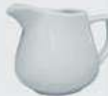
JARRITA CREMERA-LECHERA CREAMER DJC150 (150 cc.) DJL280 (280 cc.)