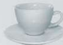
JGO. TAZA Y PLATO BISTRO CUP + SAUCER DTPB400 (400 cc.)