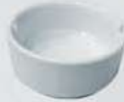
CENICERO ASHTRAY DCE