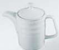
CAFETERA CON TAPA COFFEE POT + LID RCT (750 cc.)