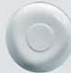
PLATO PARA TAZA SAUCER DPT0060 (60 cc.) DPT0090 (90 cc.) DPT0140 (140 cc.) DPT0170 (170/230 cc.)