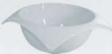
BOWL CUADRADO CURVÉ SALAD BOWL CVB15 (15x15x7 cm. - 400 cc.) CVB17 (17x17x8 cm. - 800 cc.) CVB20 (20x20x8.5 cm. - 1.000 cc.) CVB23 (23x23x9 cm. - 1.200 cc.)