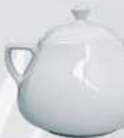
SOPERA CON TAPA SOUP TUREEN + LID DESTC (3.200 cc.)