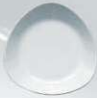
PLATO SOPERO DEEP PLATE TPS22 (22 cm.)