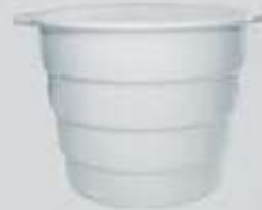
ENFRIADERA - CHAMPAÑERA WINE COOLER BUCKET RECH (20x16 cm.)