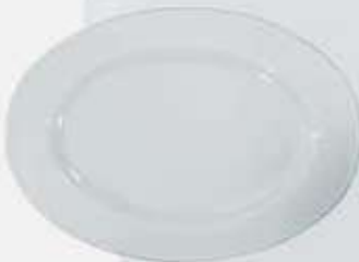
PLATÓN OVALADO OVAL PLATE DP029 (29 cm.) DP034 (34 cm.) DP039 (39 cm.)