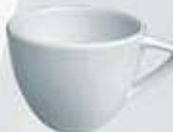
TAZA CAFÉ CUP TTC100 (100 cc.) TTC210 (210 cc.)