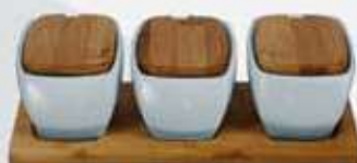
JGO. 3 BOWLS RECT. C/TAPA + BASE DE MADERA 3 RECTANGULAR BOWLS + WOOD TRAY AJ3BTBM (27x10x8 cm.)