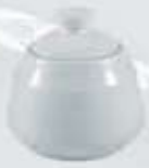
AZUCARERA REDONDA CON TAPA SUGAR BOWL + LID DAT