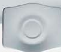
PLATO RECTANGULAR PARA TAZA SAUCER OPTR210 (15.5 cm.)