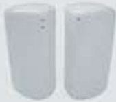
PIMENTERO-SALERO PEPPER SHAKER- SALT SHAKER TPIM TSAL