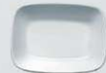
PLATÓN RECTANGULAR HONDO DEEP RECTANGULAR PLATE DEPRH14 (14 cm. - 150 cc.) DEPRH17 (17 cm. - 250 cc.) DEPRH20 (20 cm. - 450 cc.)