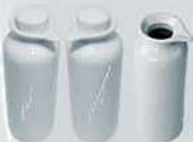
ACEITERA-VINAGRERA-JARRITA + TAPÓN BOTTLE + LID AJPCT (15x5 cm. - 150 cc.) AJP (15x5 cm. - 150 cc.) AJPT