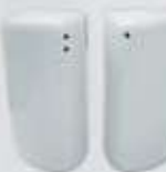
PIMENTERO-SALERO PEPPER SHAKER - SALT SHAKER TPIM TSAL