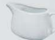
SALSERA CON ASA SAUCEBOAT DSA (400 cc.)