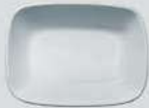
PLATÓN RECTANGULAR HONDO DEEP RECT. PLATE DEPRH14 (14 cm. - 150 cc.) DEPRH17 (17 cm. - 250 cc.) DEPRH20 (20 cm. - 450 cc.)