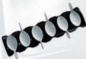
JGO DE 6 CUCHARAS DEGUSTACIÓN OVAL CON BASE NEGRA 6 SPOON + TRAY AJ6CDOB (35x14 cm.)