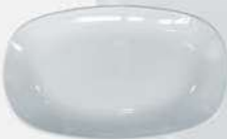
PLATÓN OVALADO SEMIHONDO DEEP OVAL PLATE DPOH39 (39 cm.)