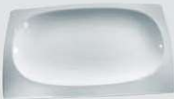
PLATÓN RECTANGULAR RECTANGULAR PLATE CVPR168 (16x8 cm.) CVPR2010 (20x10 cm.) CVPR2515 (25x15 cm.) CVPR3117 (31x17.5 cm.) CVPR3621 (36x21 cm.) CVPR4425 (44x25 cm.)