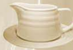
▶ SALSERA + PLATO SAUCEBOAT + SAUCER RBSACP (400 cc. - 18 cm.) RBSA (400 cc.) RBPSPA (18 cm.)