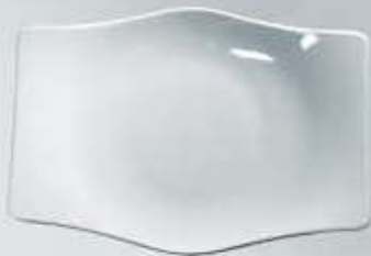
PLATO TRINCHE RECTANGULAR FLAT PLATE OPTR23 (23 cm.) OPTR27 (27 cm.) OPTR32 (32 cm.)