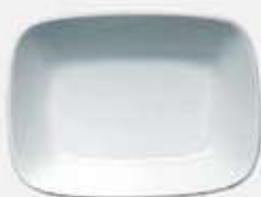
PLATÓN RECTANGULAR HONDO DEEP RECTANGULAR PLATE DEPRH14 (14 cm. - 150 cc.) DEPRH17 (17 cm. - 250 cc.) DEPRH20 (20 cm. - 450 cc.)