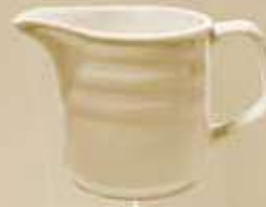
▶ JARRITA CREMERA CREAMER RBJC150 (150 cc.)