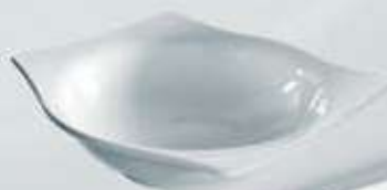
ENSALADERA RECTANGULAR SALAD BOWL OER28 (28 cm.)