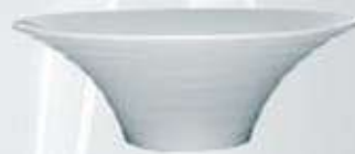
TAZÓN REDONDO BOWL ATRO20 (20 cm. - 350 cc.)