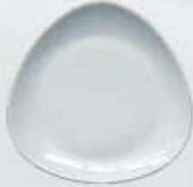
PLATO PASTEL-TRINCHE FLAT PLATE TPP21 (21 cm.) TPT27 (27 cm.) TPT30 (30 cm.)