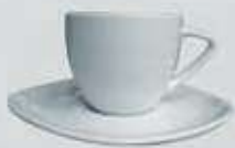
JGO. TAZA Y PLATO TRIANGULO CUP + SAUCER TTP100 (100 cc.) TTP210 (210 cc.)