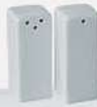
JUEGO DE SALERO Y PIMENTERO CUADRADO SQUARE SALT + PEPPER SHAKER AJSPC