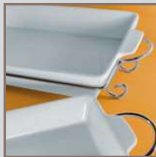
Bandejas y Fuentes