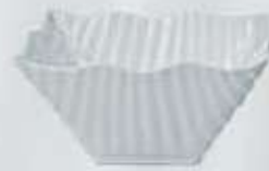
BOWL CUADRADO SALAD BOWL ABOC15 (15x15x8 cm. - 450 cc.)