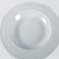
PLATO PASTA DEEP PLATE RPP30 (30 cm.)