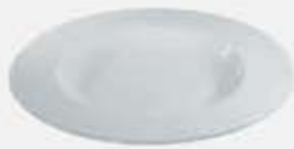
PLATO PASTA DEEP PLATE DPP30 (30 cm.)