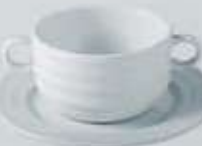
JGO. TAZÓN CONSOMÉ CON OREJAS Y PLATO CONSO MM BOWL + SAUCER RTCOP (350 cc. - 18 cm.) RTC012 (350 cc.) RPTC (18 cm.)