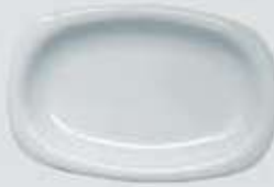
PLATÓN RECTANGULAR RECTANGULAR PLATE DEPR29 (29 cm.) DEPR34 (34 cm.) DEPR39 (39 cm.)