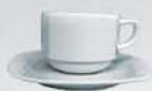
JGO. TAZA Y PLATO CUADRADO CUP + SAUCER DETEC90 (90 cc.) DETEC170 (170 cc.) DETEC230 (230 cc.)