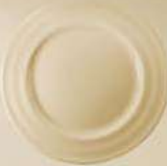
▶ PLATO PAN-PASTEL-TRINCHE-BASE FLAT PLATE RBPT16 (16 cm.) RBPT20 (20 cm.) RBPT24 (24 cm.) RBPT27 (27 cm.) RBPB32 (32 cm.)