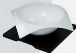
BOWL CUADRADO CON BASE SALAD BOWL + WOODEN STAND CVBB23 (23x23x9 cm.)