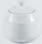
AZUCARERA REDONDA CON TAPA SUGAR BOWL + LID DAT