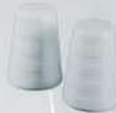
PIMENTERO-SALERO PEPPER SHAKER - SALT SHAKER RPIM RSAL