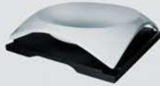
PLATO SOPERO CUADRADO CON BASE SQUARE DEEP PLATE + WOODEN STAND CVPSB20 (20.5x20.5 cm.)