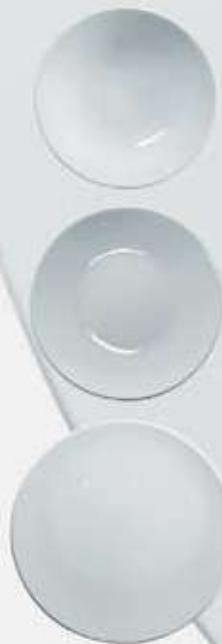
▶ PLATO SOPERO DEEP PLATE OSPS23 (23 cm.)