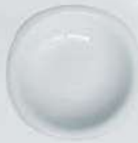
PLATO SOPERO DEEP PLATE CPPS22 (22 cm.)