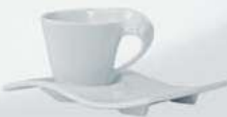
JGO. TAZA Y PLATO CUP + SAUCER CVTP90 (90 cc.) CVTP200 (200 cc.) CVTP250 (250 cc.)