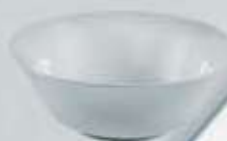
ENSALADERA SALAD BOWL DPV27 (27 cm.)