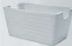
AZUCARERA SOBRES RECTANGULAR RECT. SUGAR BOWL AASRO (12.5x7 cm.)