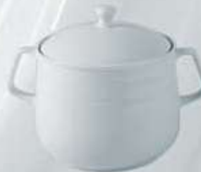
SOPERA CON TAPA SOUP TUREEN + LID RSTC (3.200 cc.)