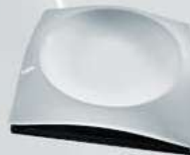
PLATO CUADRADO CON BASE SQUARE PLATE + WOODEN STAND CVPTB21 (21x21 cm.) CVPTB26 (26x26 cm.) CVPTB30 (30x30 cm.)