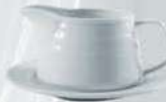
SALSERA + PLATO SAUCEBOAT + SAUCER RSACP (400 cc. - 18 cm.) RSA (400 cc.) RPSA (18 cm.)