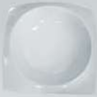
PLATO SOPERO CUADRADO SQUARE DEEP PLATE CVPS20 (20.5 x 20.5 cm.)