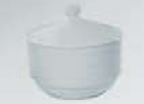
AZUCARERA CON TAPA SUGAR BOWL + LID RAT (11 cm.)