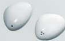
PIMENTERO - SALERO PIEDRA PEPPER SHAKER- SALT SHAKER OPIM OSAL