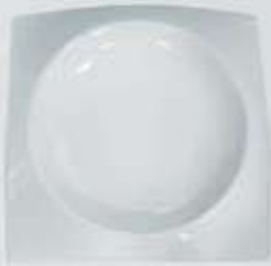
PLATITO PARA TAPAS- PLATO CUADRADO SQUARE PLATE CVPPT (8x8 cm.) CVPT10 (10x10 cm.) CVPT15 (15x15 cm.) CVPT18 (18x18 cm.) CVPT21 (21x21 cm.) CVPT26 (26x26 cm.) CVPT30 (30x30 cm.)