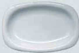
PLATÓN RECTANGULAR RECTANGULAR PLATE DEPR29 (29 cm.) DEPR34 (34 cm.) DEPR39 (39 cm.)