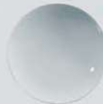
▶ PLATO PASTA O ENSALADERA SALAD BOWL OSPE26 (26 cm.)