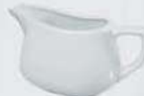
SALSERA CON ASA SAUCEBOAT DSA (400 cc.)