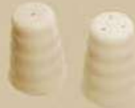
▶ PIMENTERO-SALERO PEPPER SHAKER - SALT SHAKER RBPIM RBSAL