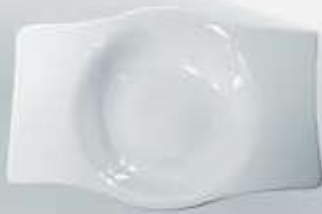
PLATO SOPERO RECTANGULAR DEEP PLATE OPSR26 (26 cm.)