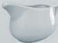
SALSERA CON ASA SAUCEBOAT DSA (400 cc.)