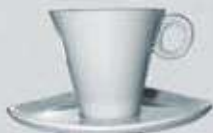
JGO. TAZA ALTA XO Y PLATO TRIÁNGULO CUP + SAUCER TTAP210 (210 cc.)