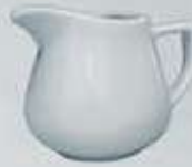
JARRITA CREMERA-LECHERA CREAMER DJC150 (150 cc.) DJL280 (280 cc.)