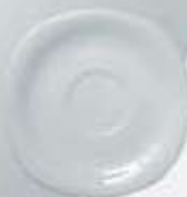
PLATO PARA TAZA CAFÉ CUADRADA SAUCER CPPT90 (90 cc.) CPPT170 (170 cc.) CPPT230 (230 cc.)