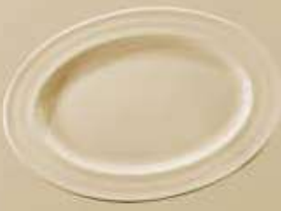
▶ PLATÓN OVALADO OVAL PLATE RBP034 (34 cm.)