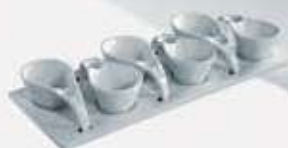
JUEGO DE 6 SALSERAS CON BASE 6 SAUCE BOWLS + TRAY AJ6SB (37x15 cm.)