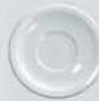
PLATO PARA TAZA RECTA SAUCER DPTR0090 (90 cc.) DPTR170 (170 cc.) DPTR230 (230 cc.)