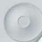
PLATO PARA TAZA BISTRO SAUCER DPTB70 (70 cc.) DPTB230 (185/230 cc.) DPTB400 (400 cc.)