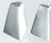
JUEGO DE SALERO Y PIMENTERO PIRÁMIDE PYRAMID SALT + PEPPER SHAKER AJSP