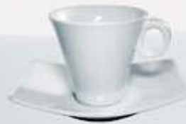
JGO. TAZA ALTA XO Y PLATO CUP + SAUCER OTPR210 (210 cc.)