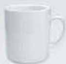
TAZA MUG CUADRADA MUG DEPMC300 (300 cc.)