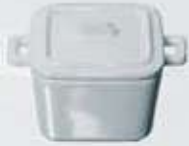
CAZUELITA MEDIANA CUADRADA CON ASAS Y TAPA SQUARE BOWL WITH HANDLES + LID ACMCT11 (9x9x4 cm. - 150 cc.)