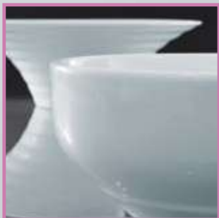
Tazones y Bowls