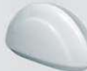
SERVILLETERO NAPKIN HOLDER DSV