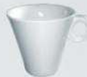
TAZA CAFÉ ALTA XO CUP OTCR210 (210 cc.)